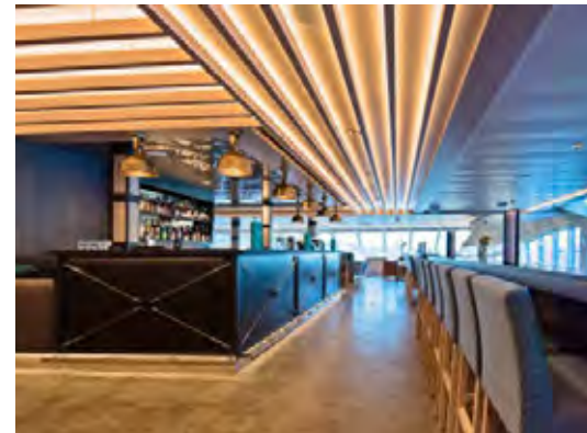
EXPLORER SALON & BAR