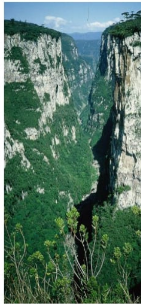
Canyons im Süden