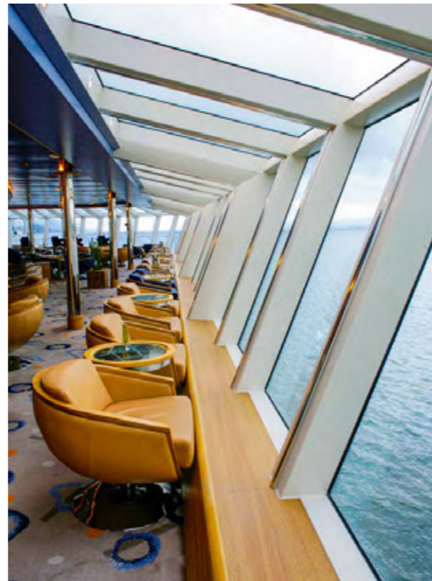
EXPLORER SALON & BAR