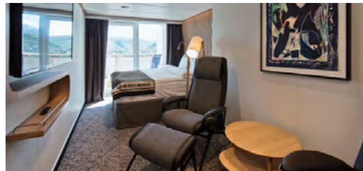
ARKTIS AUSSENKABINE SUPERIOR, AUSSENKABINE XT