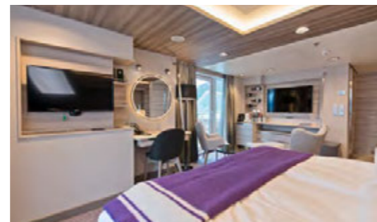
EXPEDITION SUITE, ECK-SUITE MC